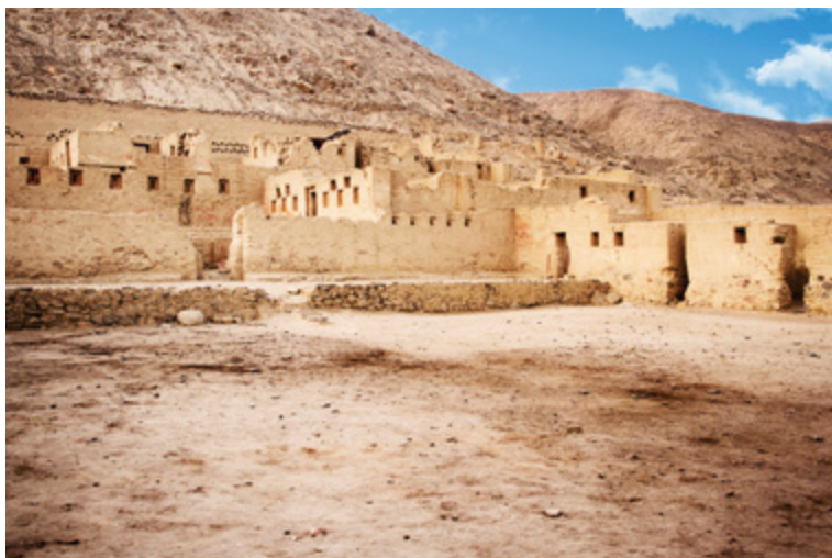
Figura 6. Sitio Arqueológico Tambo Colorado. Ica, Perú.

El objetivo del programa es reinsertar el sitio arqueológico a la dinámica cotidiana de la población adyacente, fomentando el uso público del bien cultural. Asimismo, generar los puentes necesarios para facilitar el trabajo con el área técnica del Ministerio de Cultura para la delimitación y el saneamiento físico legal.