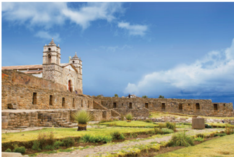
Figura 4. Ciudad de Vilcashuamán, vista del Templo del Sol (inca) con la superposición de la Iglesia San Juan Bautista. Ayacucho, Perú.

El problema principal de este sitio arqueológico, es la ocupación continua por parte de la población. Luego de la caída del Imperio inca, la ciudad siguió ocupada hasta el presente. Esta superposición de ocupaciones implica un conflicto entre la población y el Ministerio de Cultura. Este conflicto, sumado a los trámites burocráticos, repercute en la difícil instalación de los servicios básicos, la inscripción de los títulos de propiedad de los predios, la planificación urbana y sobre todo en la visión de construir una propuesta de desarrollo en conjunto entre la ciudad de Vilcashuamán y su patrimonio arqueológico.