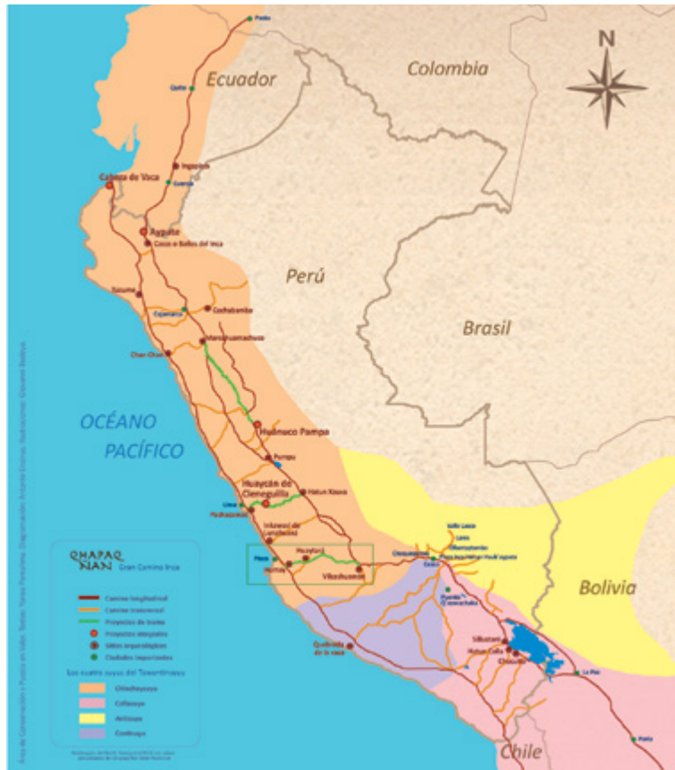
Figura 1. Plano de ubicación del Proyecto de Tramo Vilcashuamán-Pisco.

en uso social: Huaycán de Cieneguilla, Huánuco Pampa, Cabeza de Vaca y Aypate; y cinco proyectos de tramo: 5 Xauxa-Pachacamac, Vilcashuamán-Pisco, Huánuco Pampa-Huamachuco, La Raya-Desaguadero y Quebrada de La Vaca-Tambobamba.