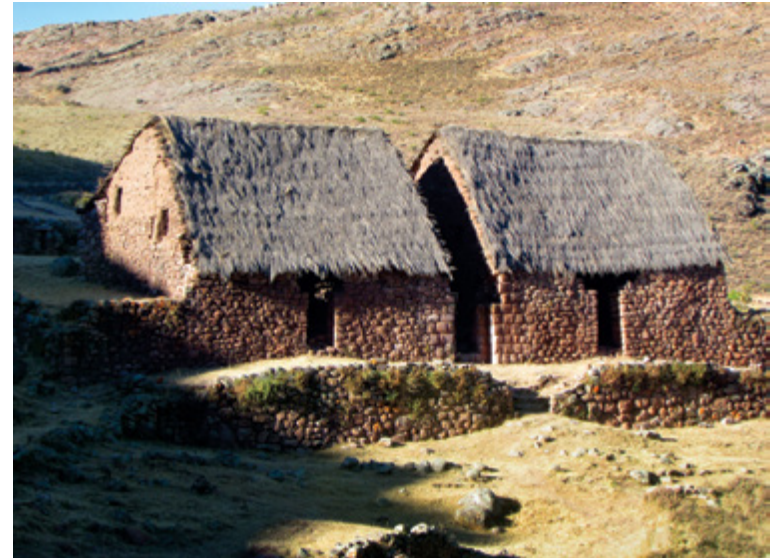
Figura 5. Sitio Arqueológico Inkawasi de Huaytará; estructuras incas techadas. Huancavelica, Perú.