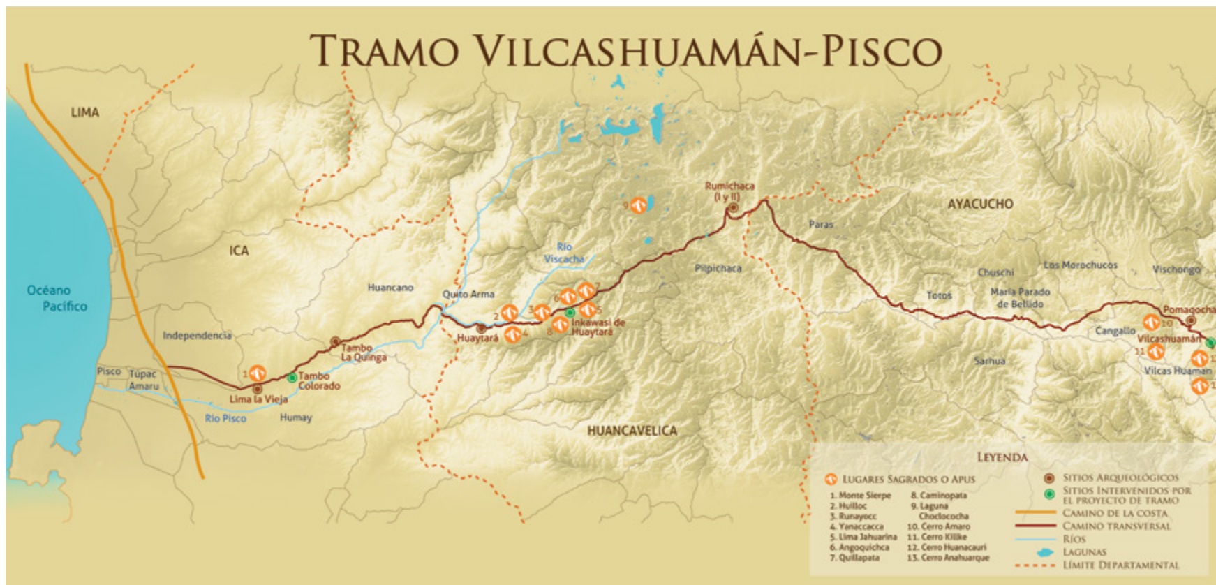
Figura 2. Corte transversal del Tramo Vilcashuamán-Pisco (Caja, 2007).